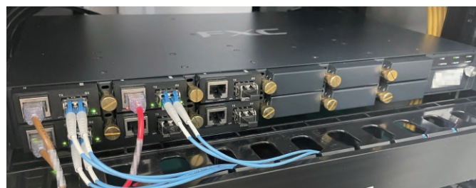
サーバールームに設置された「LEX1012-15」、「LEX1851-1F」