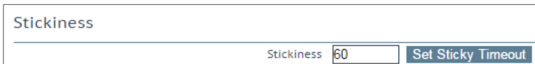
図 2-2:スティッキネス

「スティッキネス」としても知られる GSLB パーシステンズとは、各クライアントからのすべての名前解決要求を、指定された時間が経過するまで同じリソースセットに送信することを可能にするプロパティです。これにより、ユーザーはセッション固有のデータを取得/操作することが可能になります。