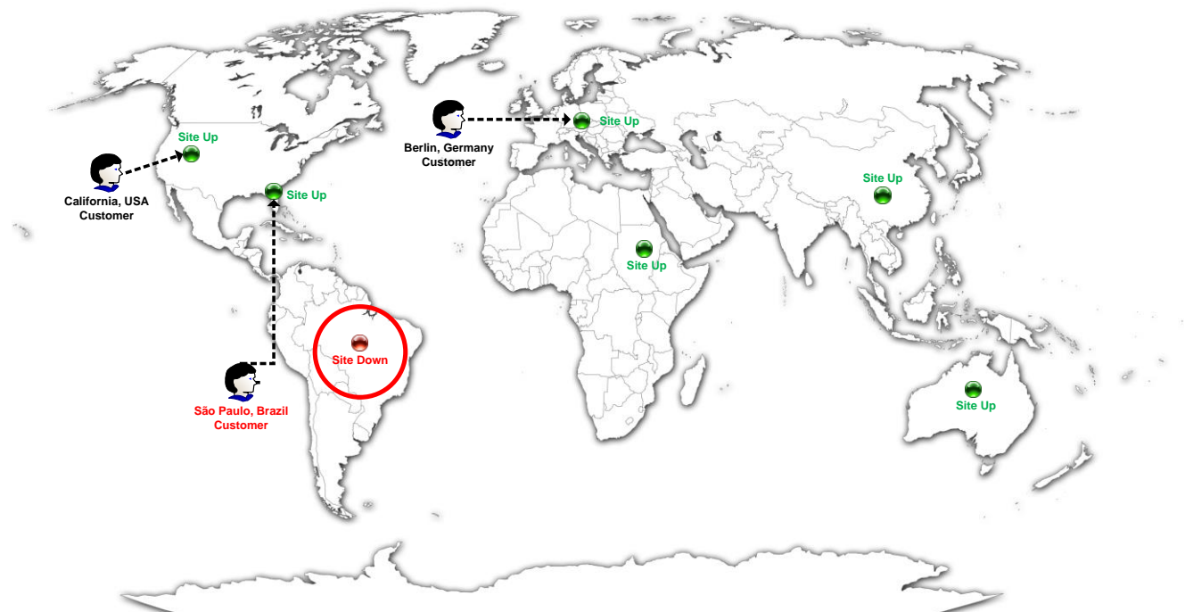
図 2-1: グローバルマルチデータセンターの負荷分散の例