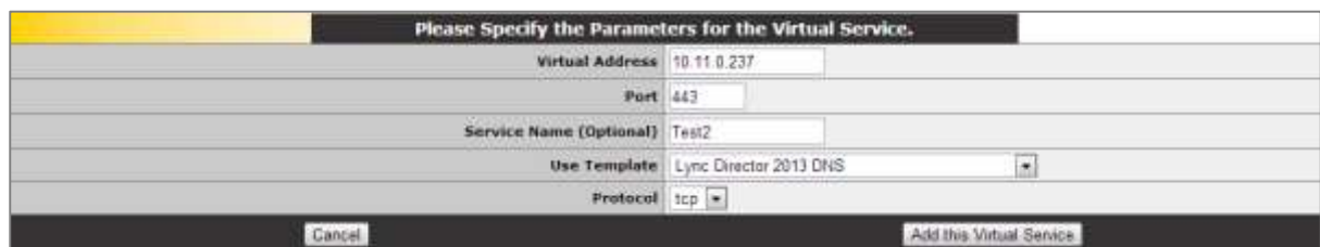
図 3-1:仮想サービスのパラメータ

テンプレートは、“Manage Templates”画面にてロードマスターにインポート/インストールできます。この画面の詳細については、 ウェブユーザーインターフェイス (WUI) 設定ガイド を参照してください。