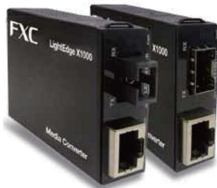
LEX1841シリーズ (1芯タイプ) LEX1841-1F (SFPタイプ)