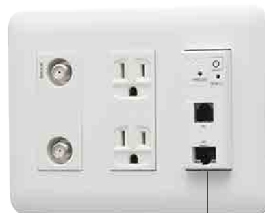
*情報コンセント内に取付た状態

プロバイダー提供環境に応じて、RT(ルータ)モードと AP(アクセスポイント)モードの切替が可能。