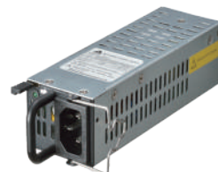
リダント電源ユニット