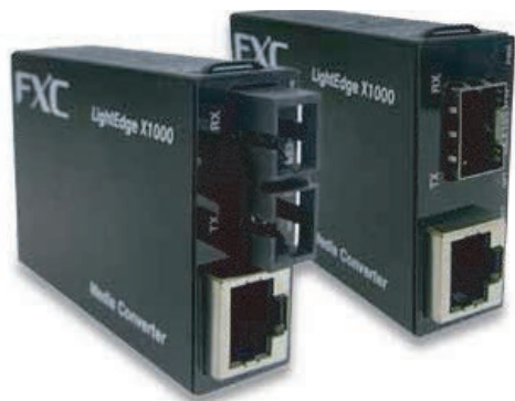
LEX1852シリーズ (2芯タイプ) LEX1851-1F (SFPタイプ)